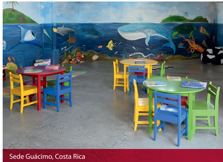
Sede Guácimo, Costa Rica